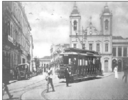
1904. Largo da Sé.