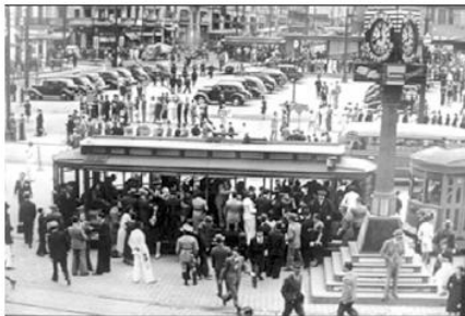
Anos 50. Praça da Sé.

Ricota temperada com Azeite, Sal e Salsa; mini tomates Italianos, salpicados com Parmesão ralado