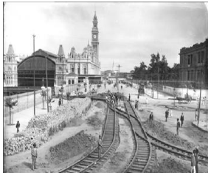
1902. Instalação de trilhos de bonde na Estação da Luz.